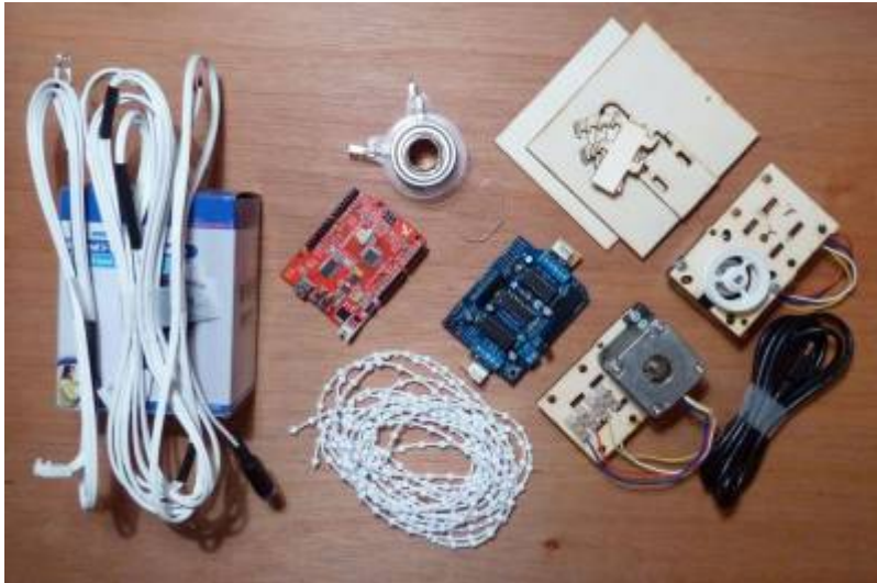
(photographie à refaire/remodifier...)