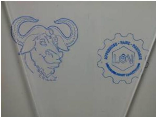
... les premiers essais ...